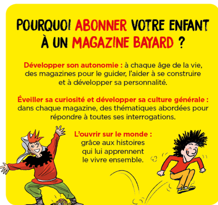
Illustrations : Anatole Latulle © Clément Deveaux - Gibus © Sylvain Frécon

Un magazine pour lire couramment en anglais et se cultiver : l'atout pour progresser en anglais et préparer son avenir.